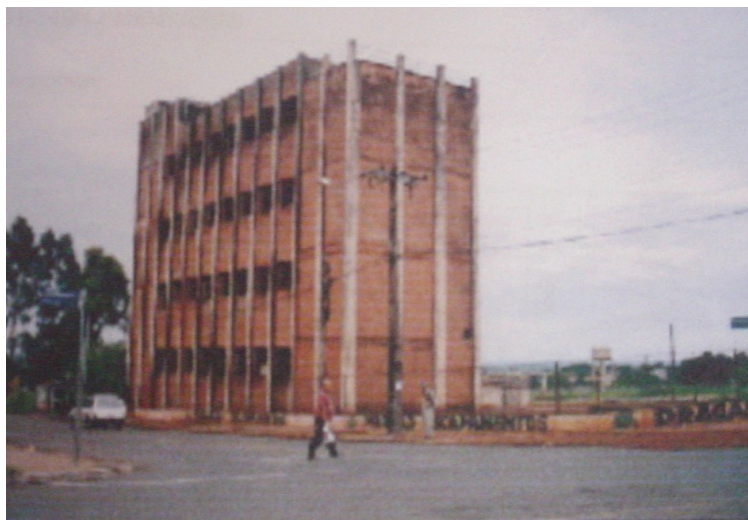
Vista geral do barracão.