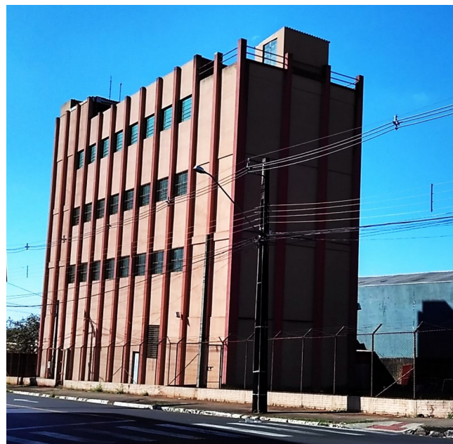
Vista geral do barracão.