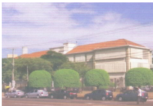
Foto do Colégio Marista - Dec. 50