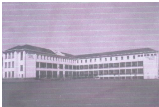
Foto do Colégio Marista - Dec. 50