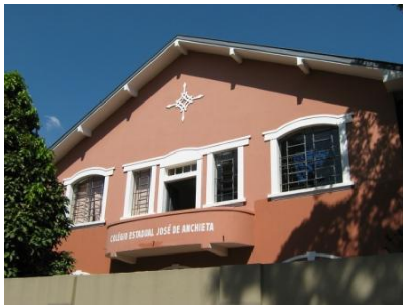
Fachada principal