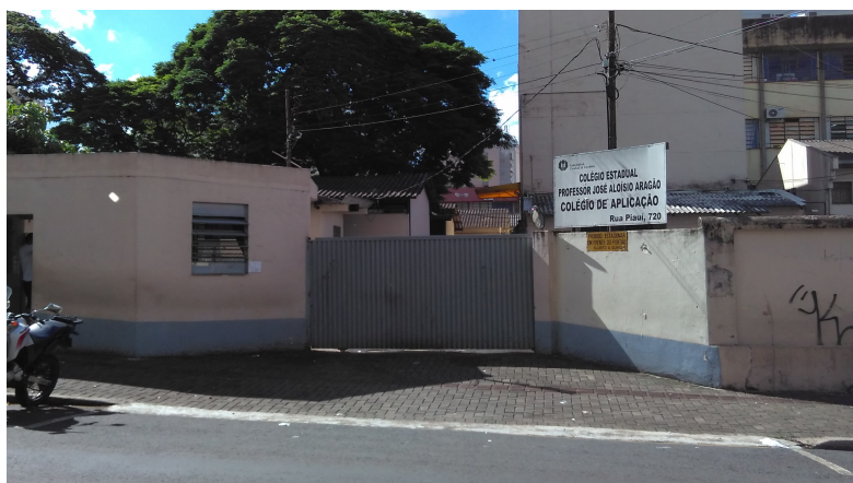
Portão de Acesso.