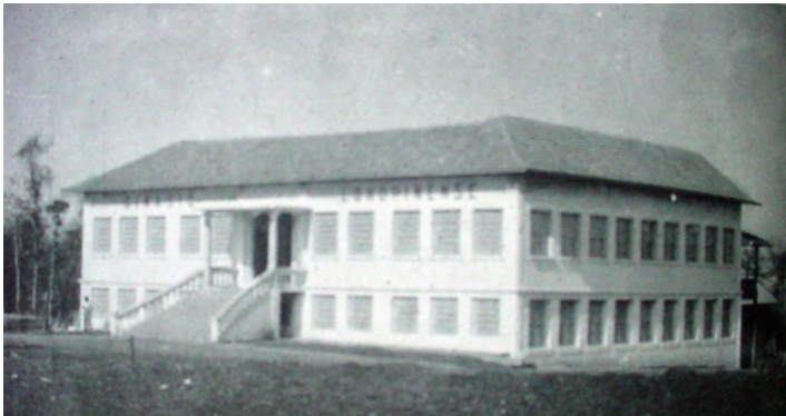
Imagem de Época