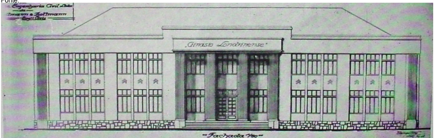
Imagem de Época