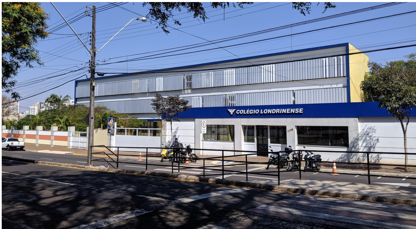
Imagem atual, 2019