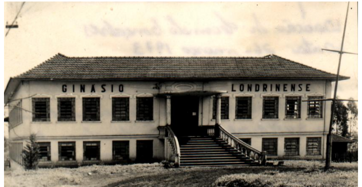
Imagem de Época Fonte: