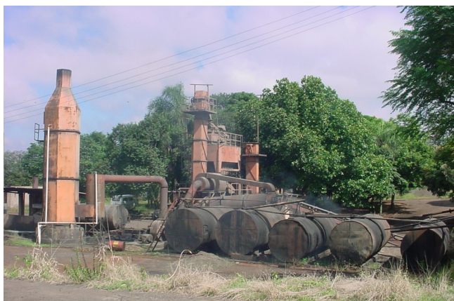
Usina de Asfalto