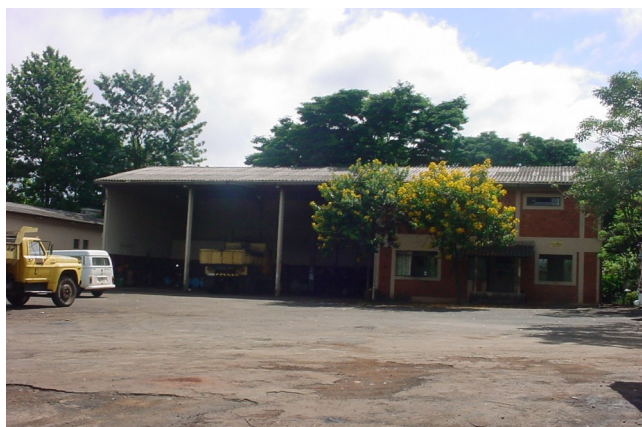
Administração e Oficina garagem