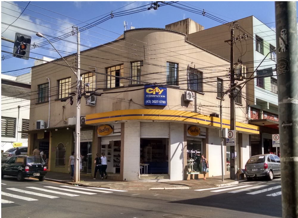
Vista da Esquina, 2018