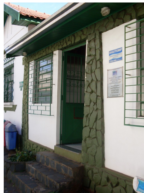
Fachada da residência.