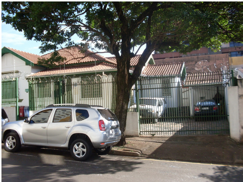
Fachada da residência.