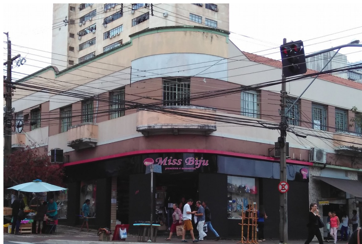
Edifício em 2018