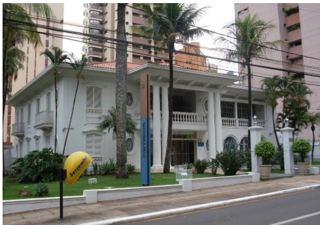
Vista externa – fachada principal.