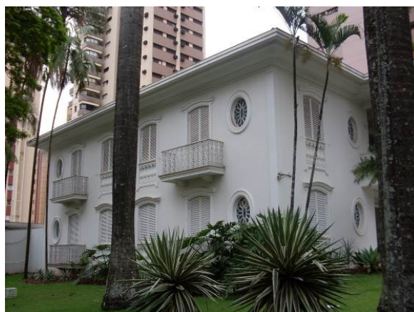
Vista externa – fachada lateral.