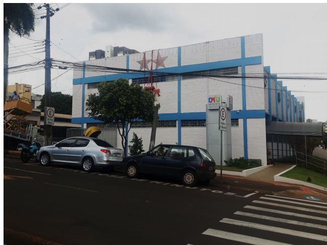
CMTU atualmente.