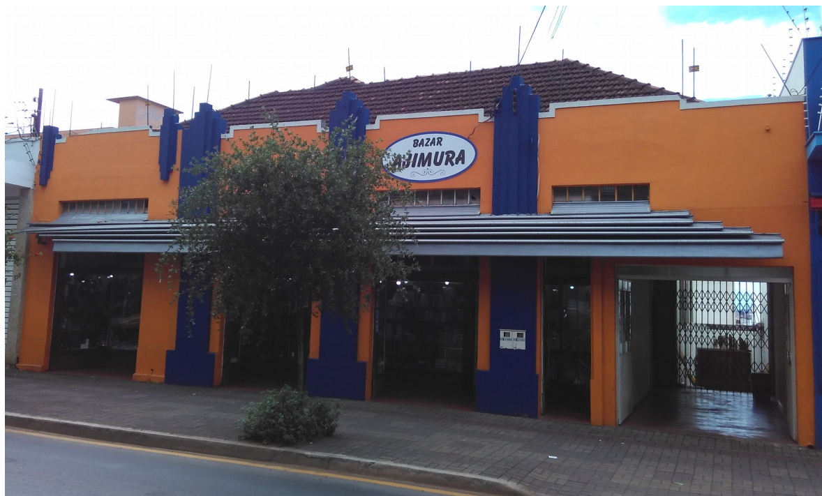
Edifício em 2018