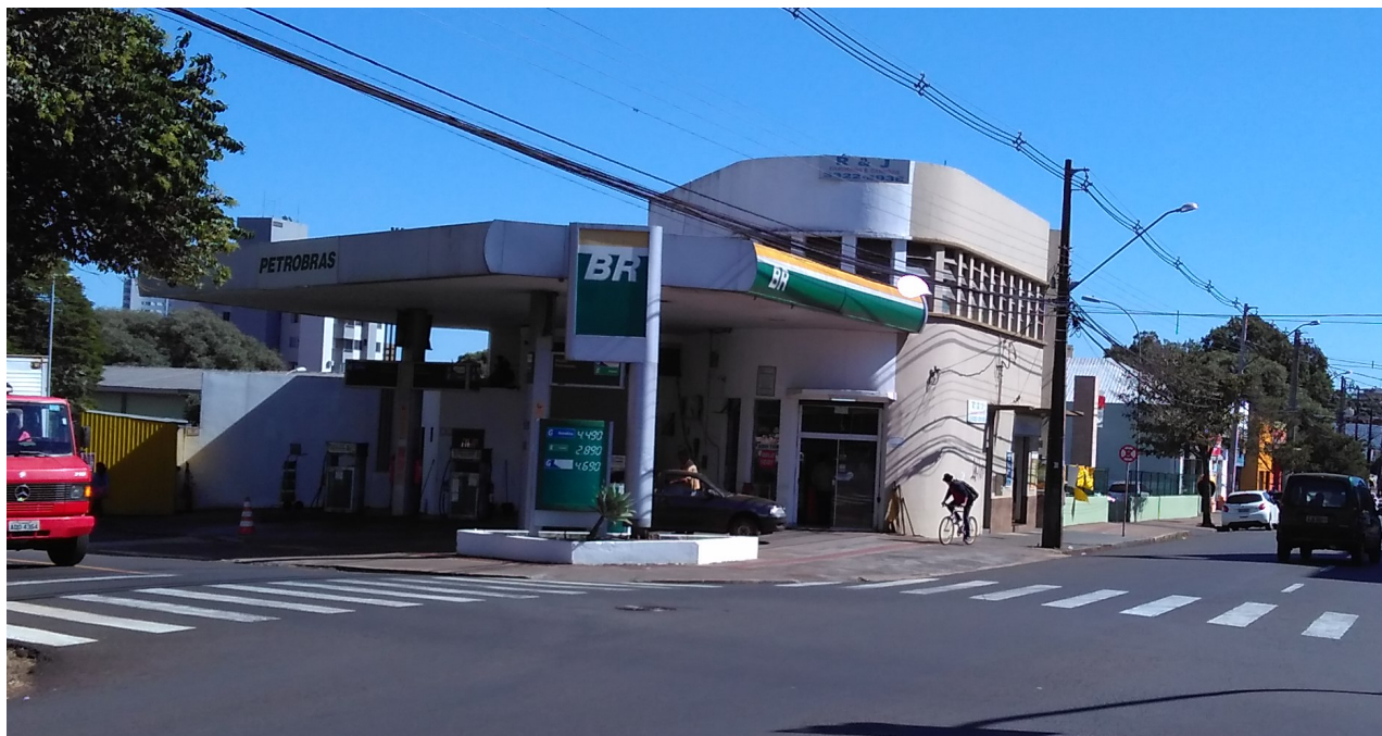
Fachada em 2018