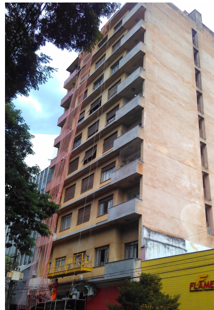
Edifício Rádio Londrina na década de 50 e 60 respectivamente