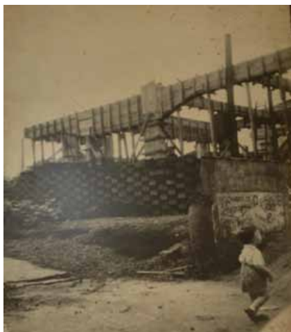
Fig. 01: Início da construção da Rádio Londrina S.A. No ano de 1952