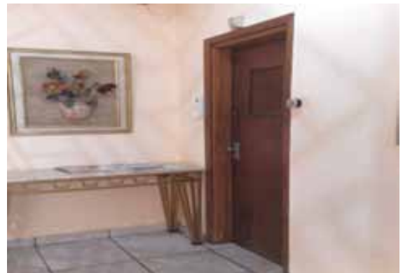
Imagem 1: Composição de fotos referente ao estado atual dos detalhes da edificação