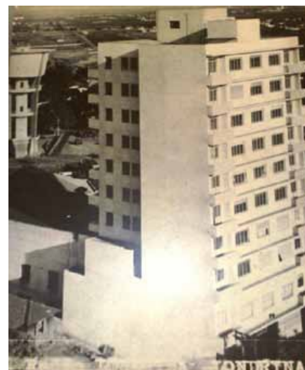
Fig. 05: Edifício Rádio Londrina na década de 1960, apresenta a volumetria atual (2011). Fonte: Acervo particular da rádio Londrina S.A Organização: Equipe