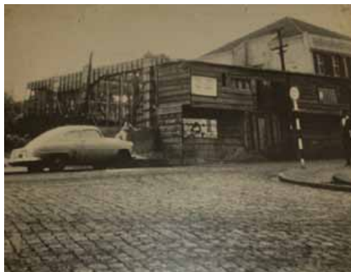
Fig. 02: Início da construção da Rádio Londrina S.A. no ano de 1952 Fonte: Acervo particular da rádio Londrina S.A Organização: Equipe