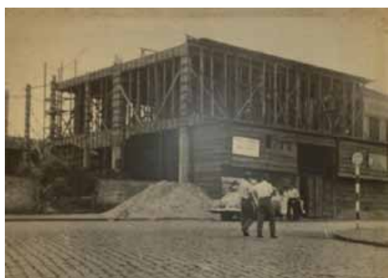
Fig. 03: Início da construção da Rádio Londrina S.A. no ano de 1952 Organização: Equipe