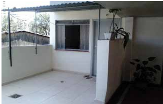
Imagem 1 - Fotos referente a dispensa transformada em kitnet