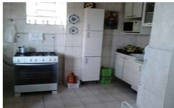
Imagem 2 - Fotos referente a cozinha ampliada