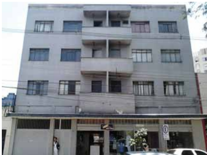
Edifício comercial em 2011