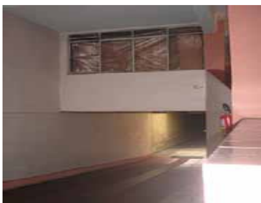
Imagem 3 - Fotos referente a sala comercial acima de rampa de acesso