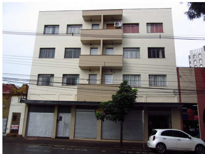
Edifício comercial em 2018