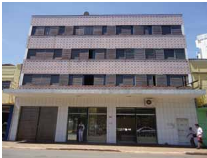
Edifício em 2011