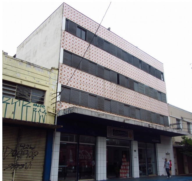
Edifício em 2018