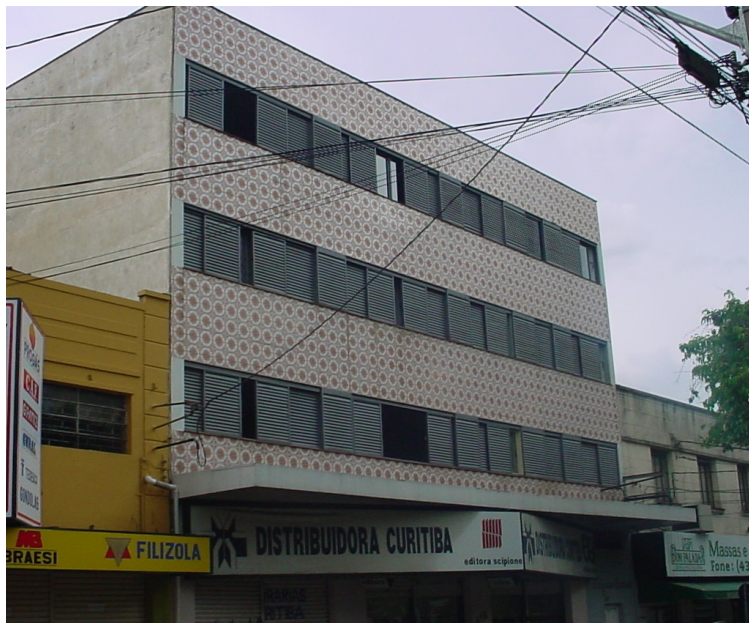
Edifício em 2006