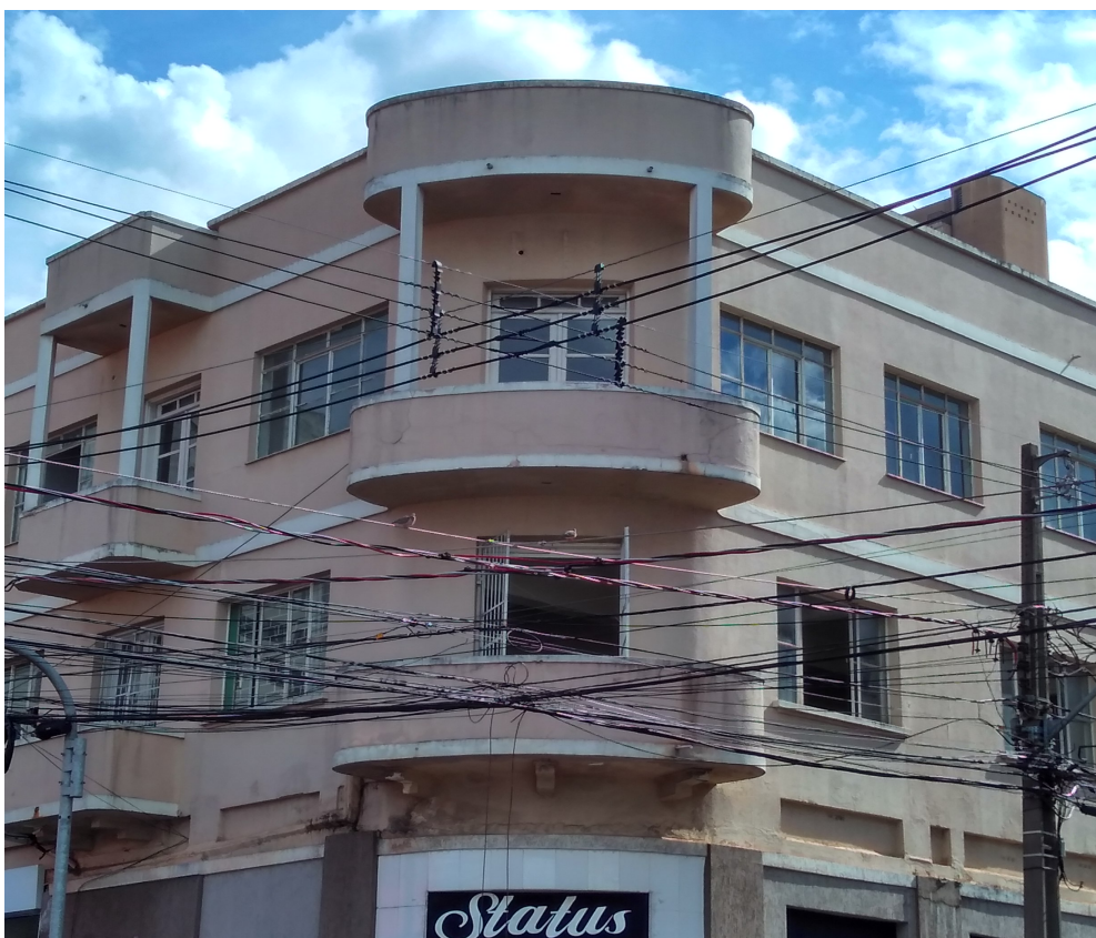
FACHADA PRINCIPAL - ESQUINA