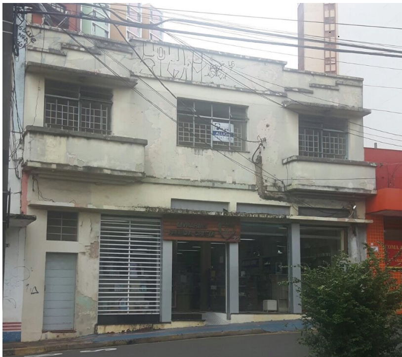
Edifício em 2018