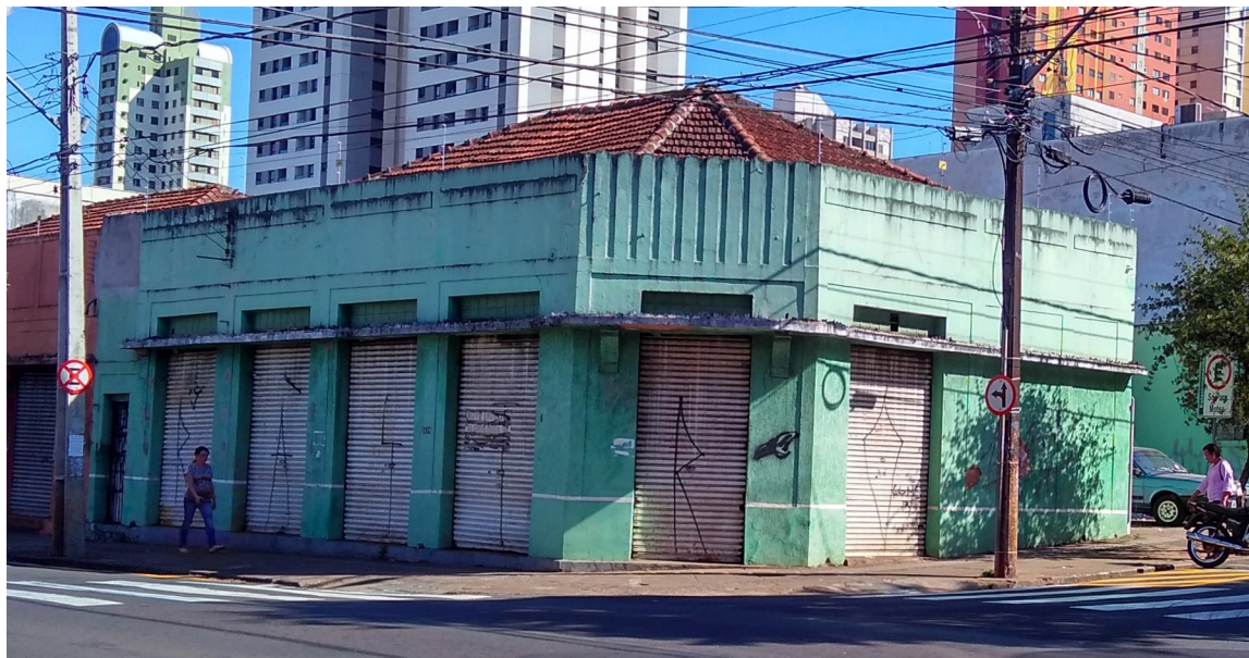
Fachada, com a Av. Duque de Caxias e R. Santa Catarina, 2016