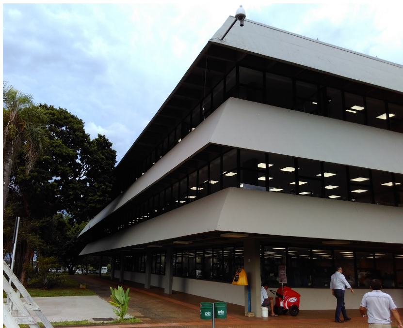
Fachada da prefeitura