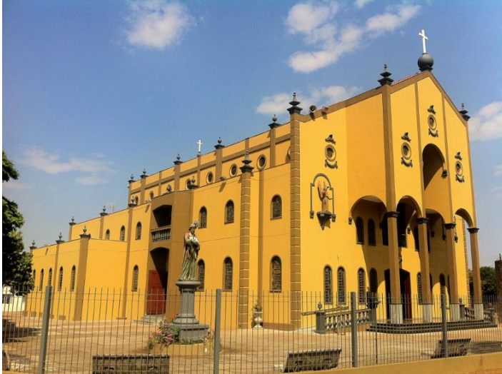
Fachada principal e lateral do santuário