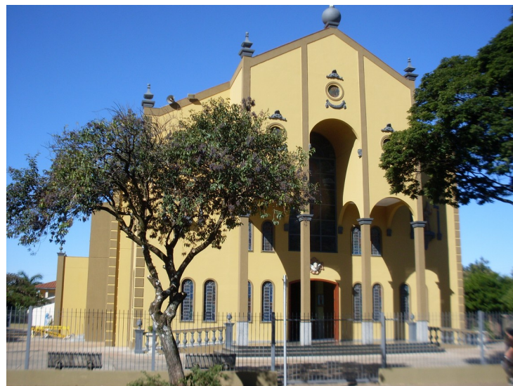
Fachada do santuário