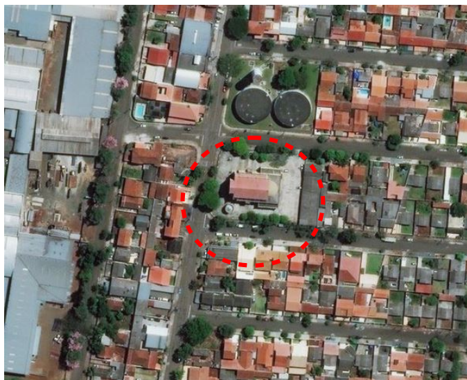
Vista aérea