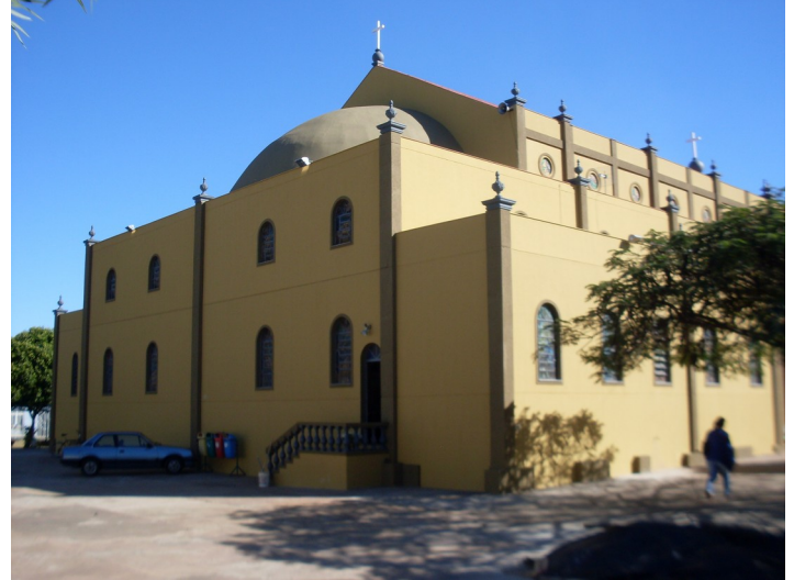
Fachada do fundo do santuário