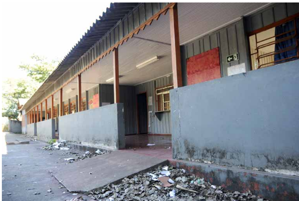
Escola atualmente sem uso.