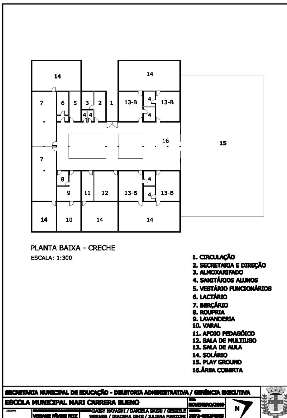
Planta Térreo – CRECHE (2009)