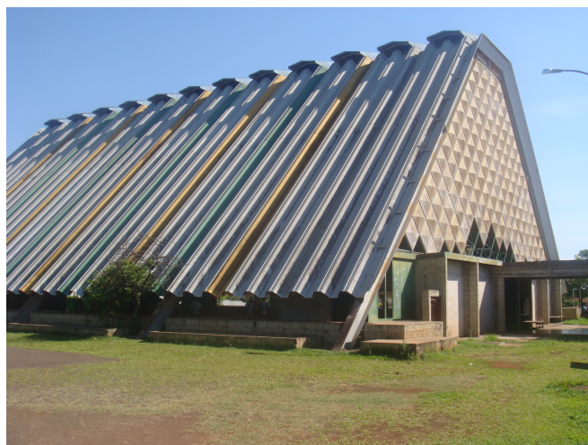
Vista 2009