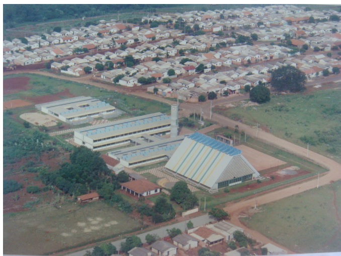
Vista aérea – inauguração 1999