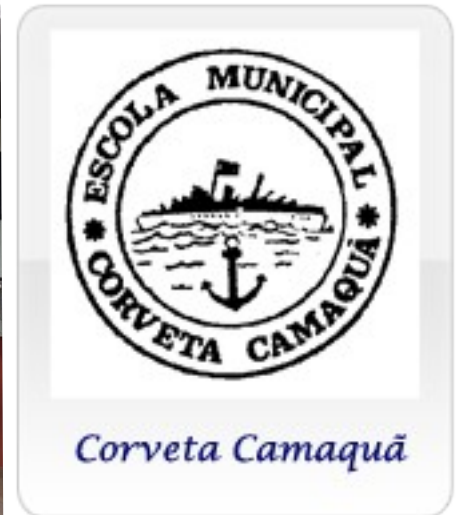
Símbolo da escola