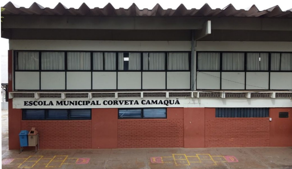
Vista da fachada da escola