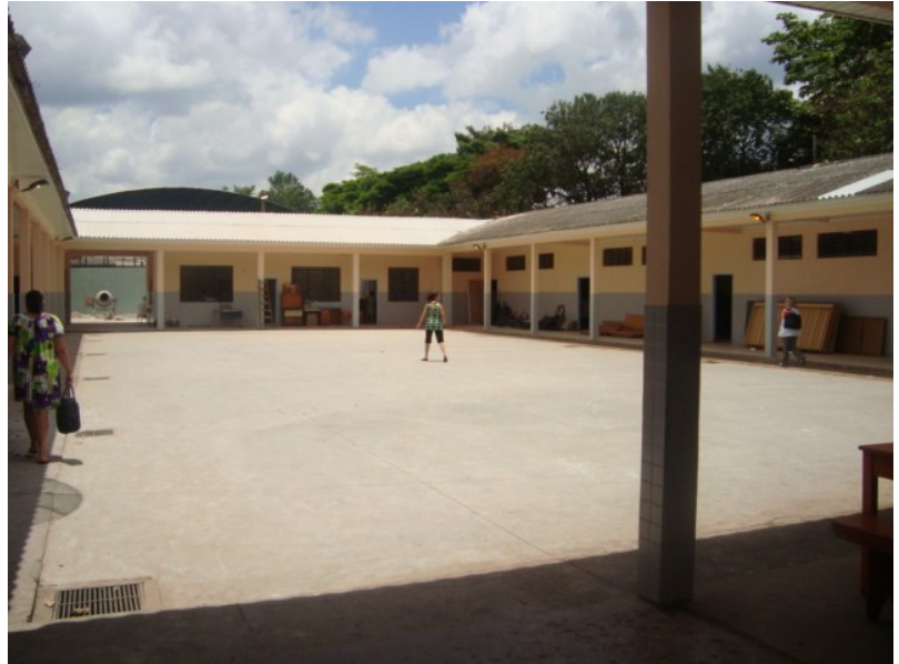
VISTA DO PÁTIO