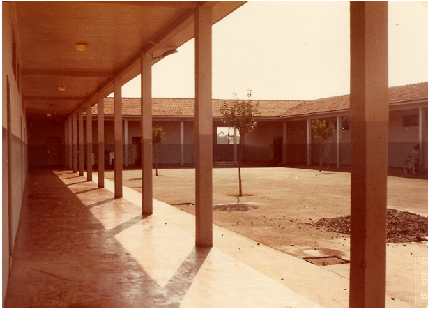
CONSTRUÇÃO DO PÁTIO EM 1982