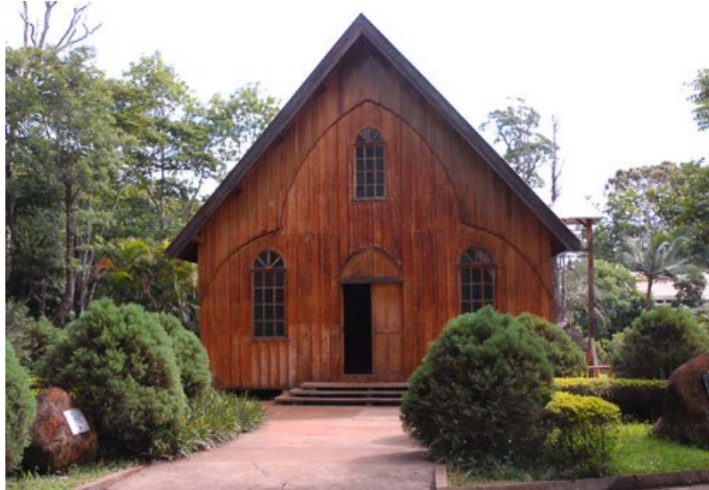
Vista da edificação