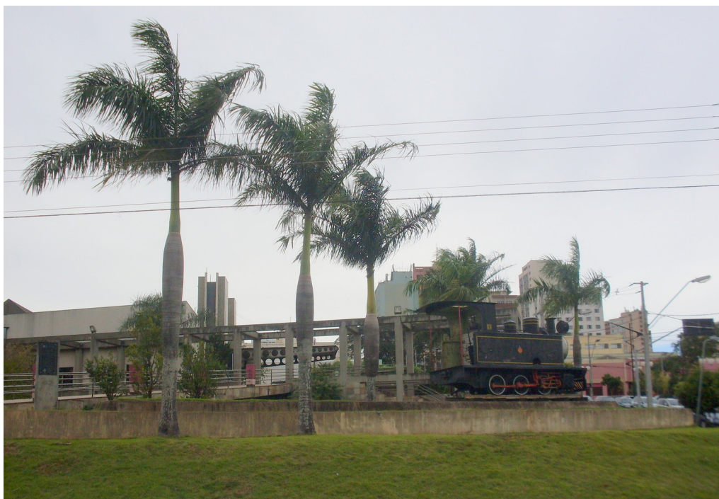
Pronto Atendimento Infantil – Fachada voltada a Leste-Oeste.