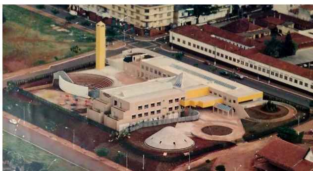
Conjunto formado pelo Planetário e Super Creche.