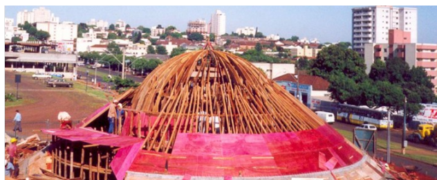
Construção do planetário em 1991.