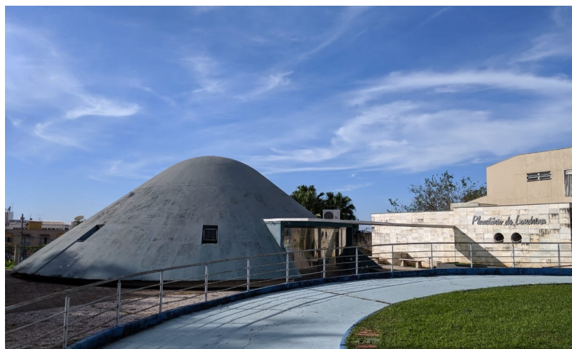
Imagem recente, 2019.