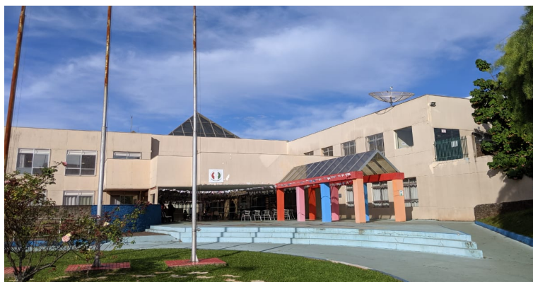
Entrada principal, 2019