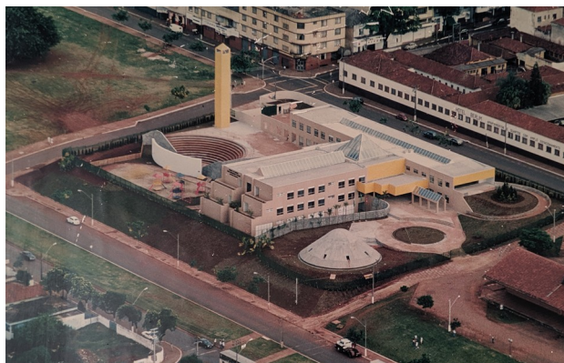
Imagem antiga, 19XX

Fonte: Quadro exposto na diretoria de patrimonio histórico.