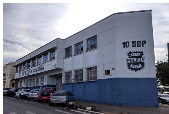
Delegacia desativada, 2019.