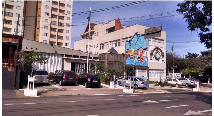
VISTA ATUAL DA EDIFICAÇÃO, 2018.