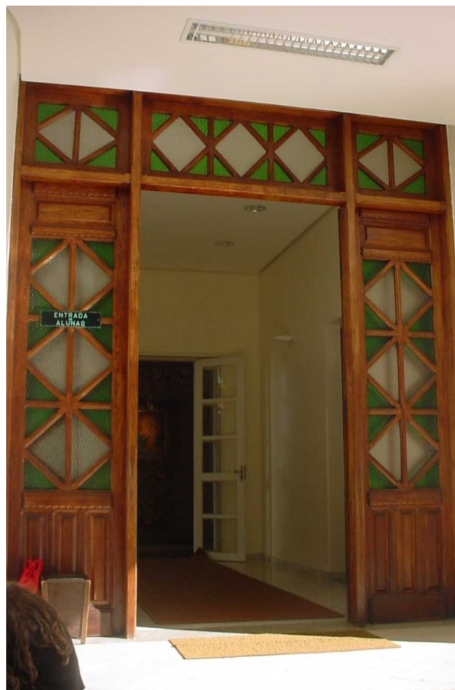
Da esquerda para a direita: réplica do santuário de Schönstatt, na Alemanha; porta com vitral original e terceira ala onde funciona internato e juvenato.