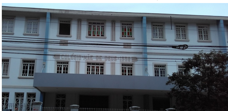
Leteiro da fachada principal.