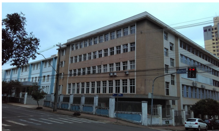
Vista do colégio esquina da Av. São Paulo com Rua Pará.