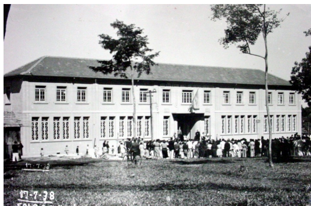
Inauguração do edifício do Colégio, 17/07/1938