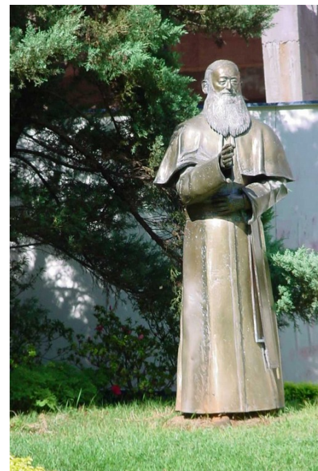
Padre José Kentenich: fundador da obra Schoenstatt.