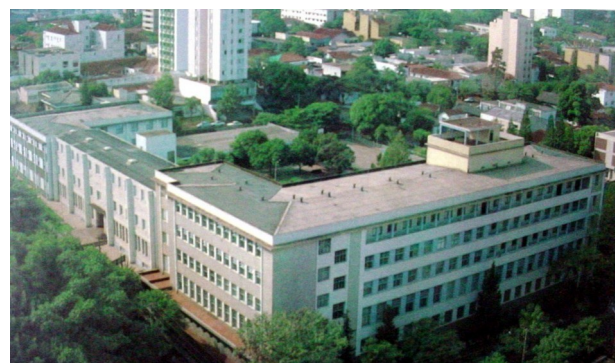
Vista aérea do colégio