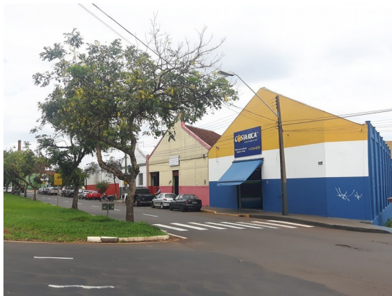
Fachada da esquina atualmente.