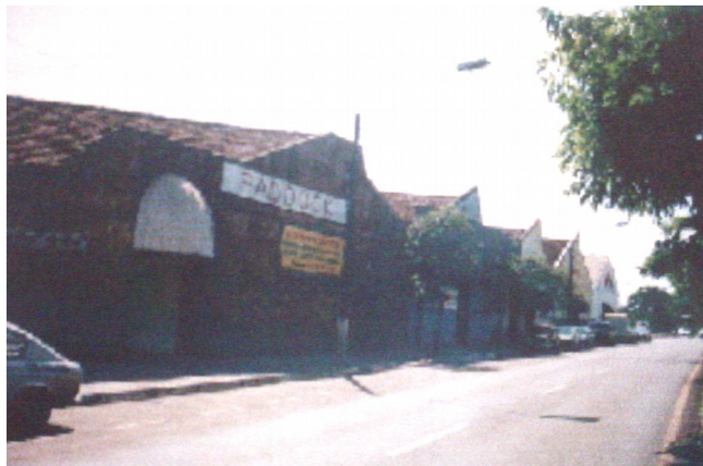
Fachada principal do antigo armazém.