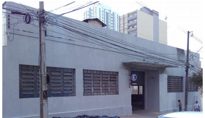
Fachada atualmente.