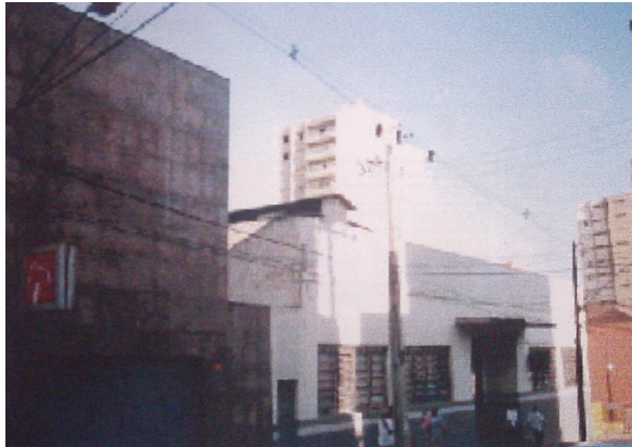
Fachada principal.