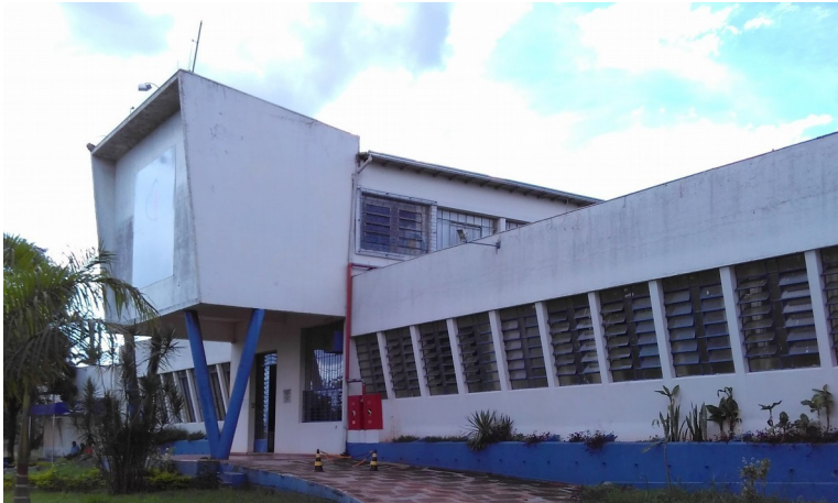
FACHADA PRINCIPAL, 2018