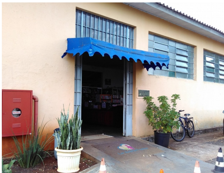
BAZAR ANÁLIA FRANCO, 2018