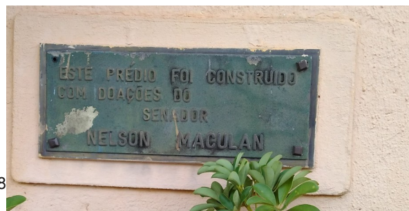
PLACA BAZAR ANÁLIA FRANCO, 2018