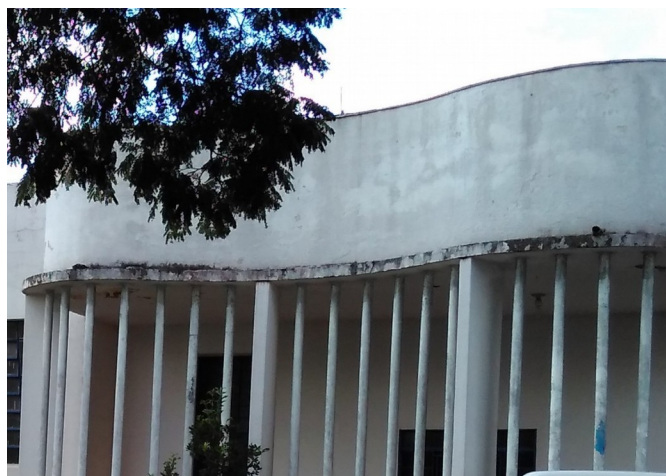
DETALHE FACHADA PRINCIPAL, 2018