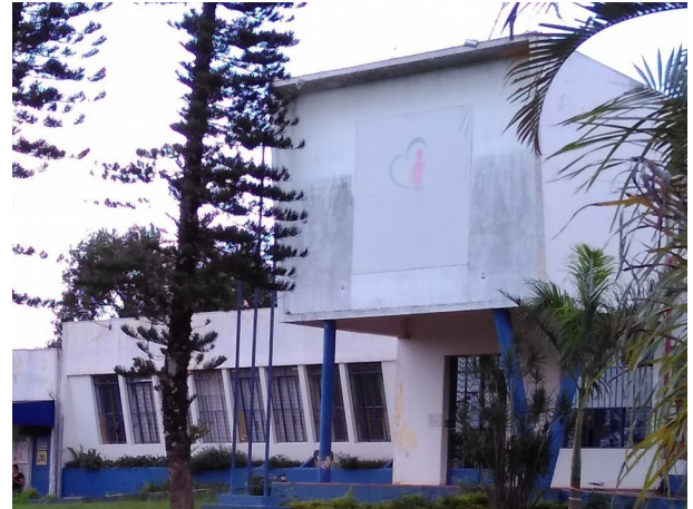
FACHADA PRINCIPAL, 2018