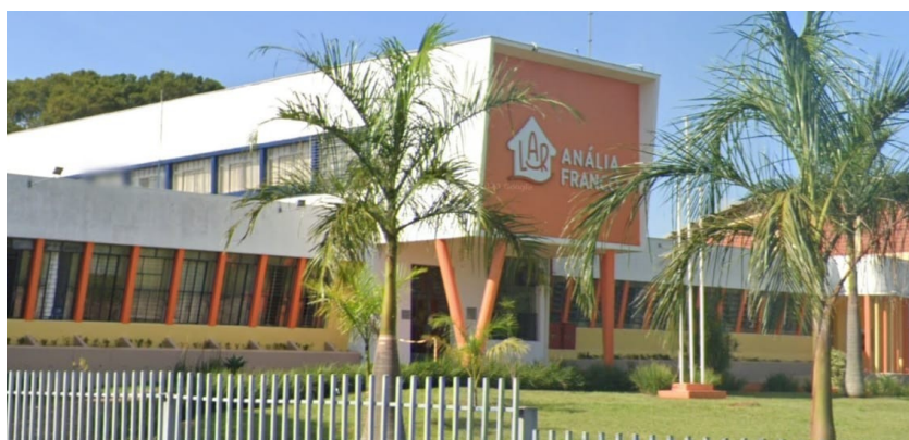
FACHADA PRINCIPAL, 2023