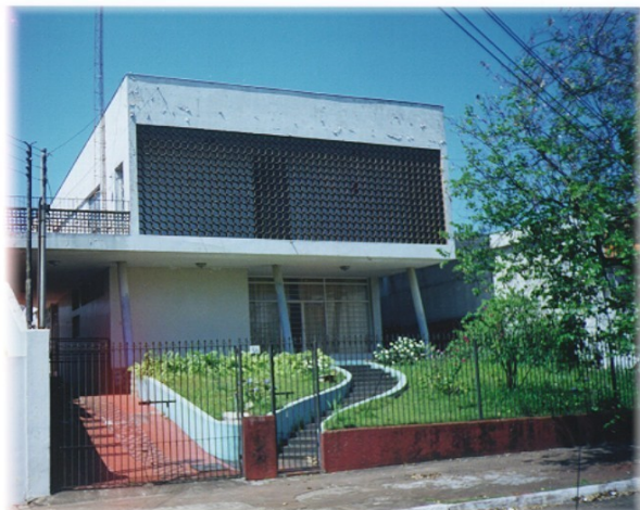
Edificação com seu aspecto mais próximo do original