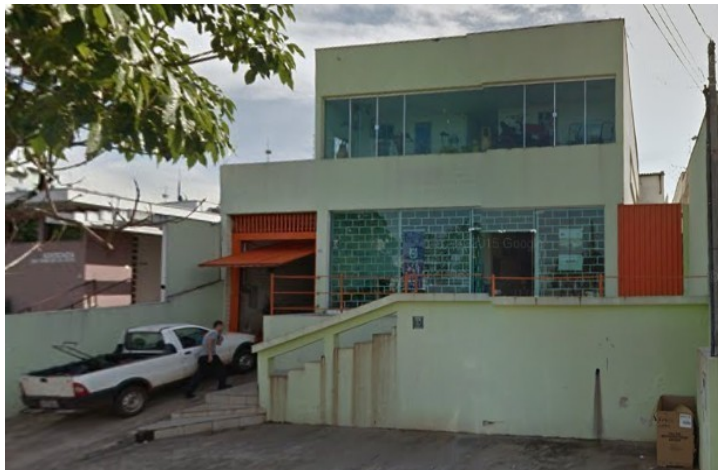
A edificação encontra-se modificada.