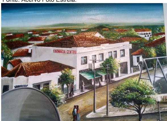
Pintura feita sob imagem monocromática da década de 1950.