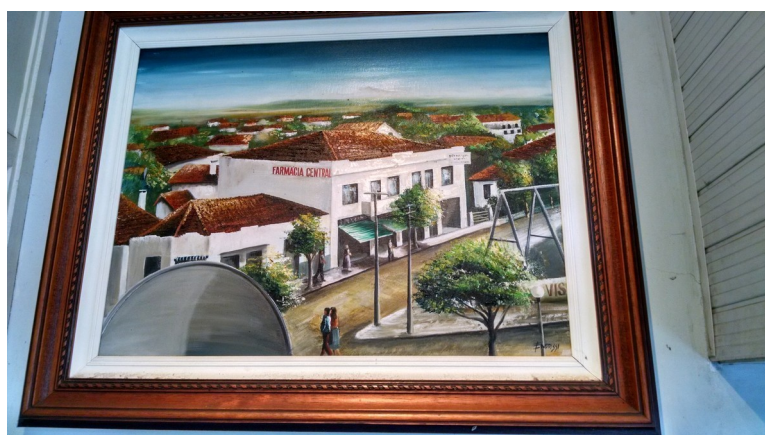
Pintura feita sob imagem monocromática da década de 1950.

Levantamento Diretoria de Patrimônio Histórico-Cultural Aline Terra