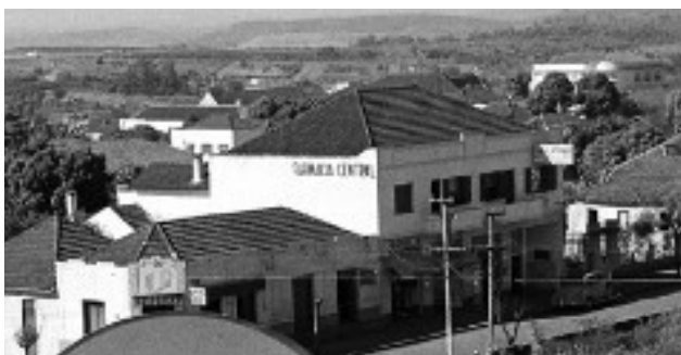
Farmácia Central na década de 1950.