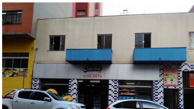
Farmácia Central, 2018.