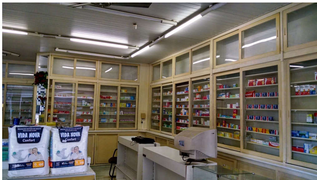
Interior da Farmácia Central, 2018.