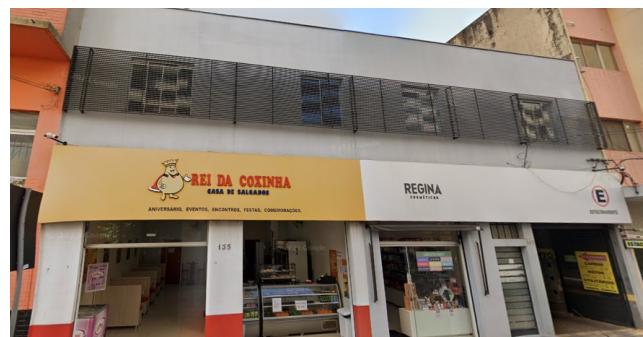
Atualmente lanchonete Rei da Coxinha 2023