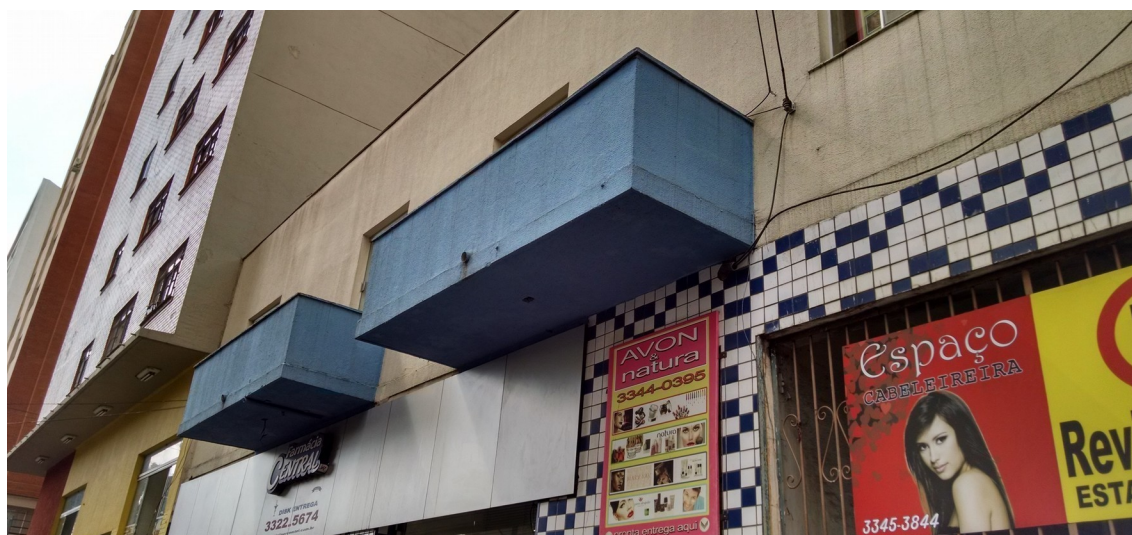
Elementos remanescentes, 2018.