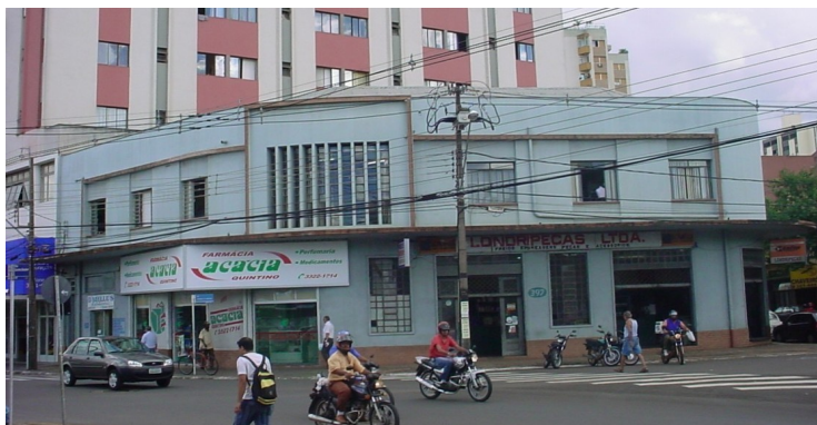
Farmácia Acácia, 2006