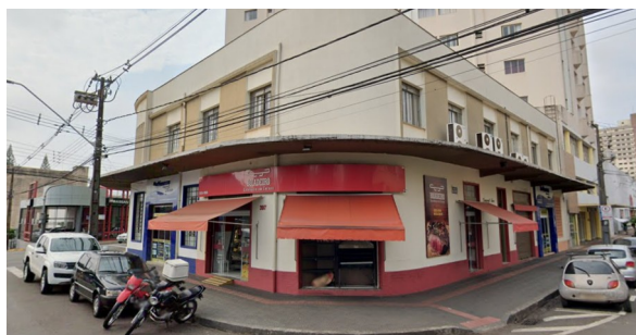
Açougue Boiadeiro, 2019