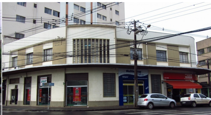
Vista da esquina da edificação.