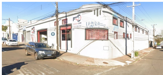
Fachada principal atualmente, 2023