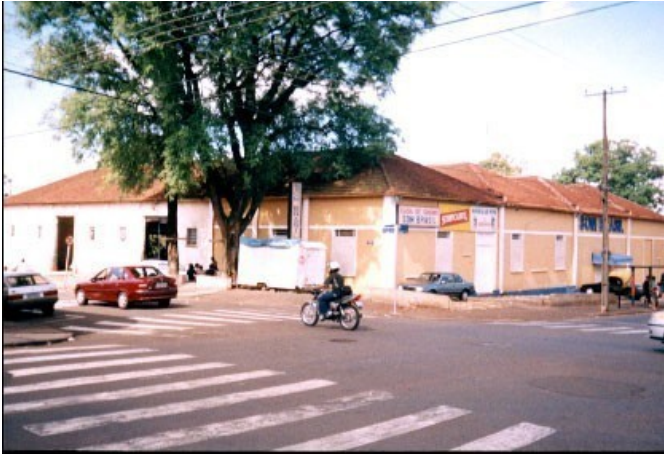
Fachada principal do antigo armazém.