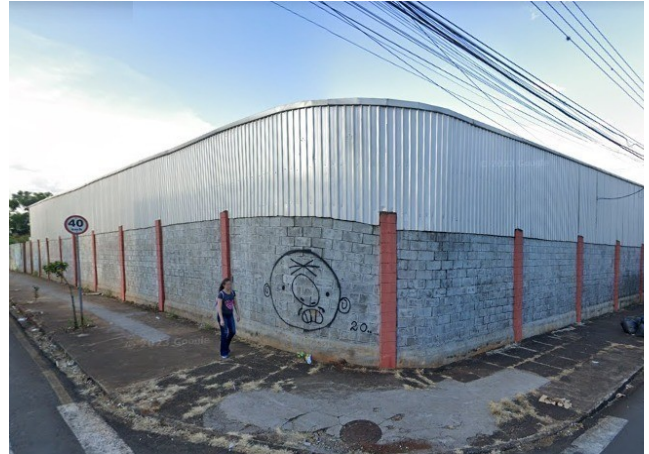
Fachada principal atualmente, 2023