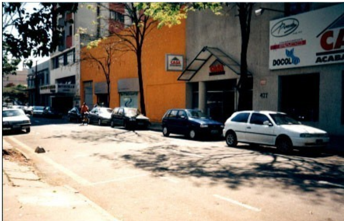
Fachada principal.