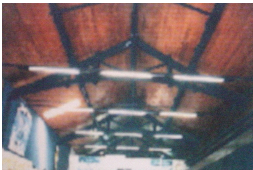
Detalhe da estrutura da cobertura depois da reforma.