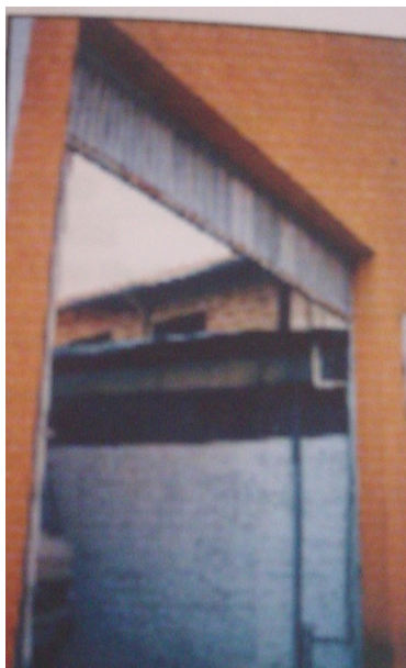
Acesso lateral: ao fundo, observa-se as vedações em madeira preservadas.