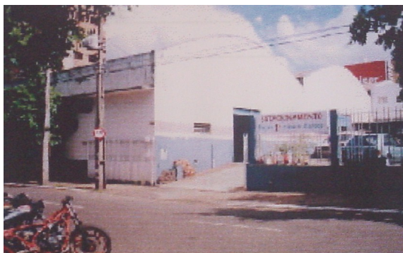
Vista geral do armazém.