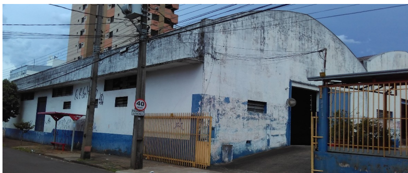
Vista geral do armazém.