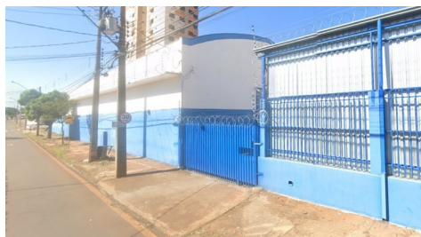
Vista geral atualmente, 2023