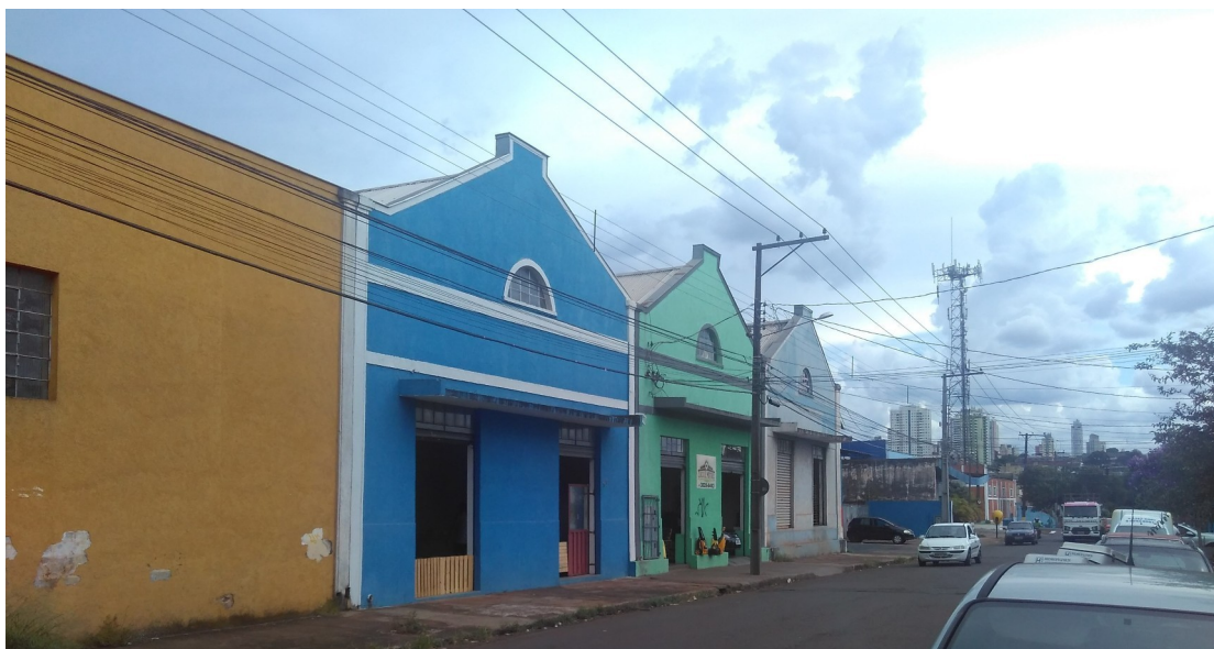
LATERAL DO EDIFÍCIO