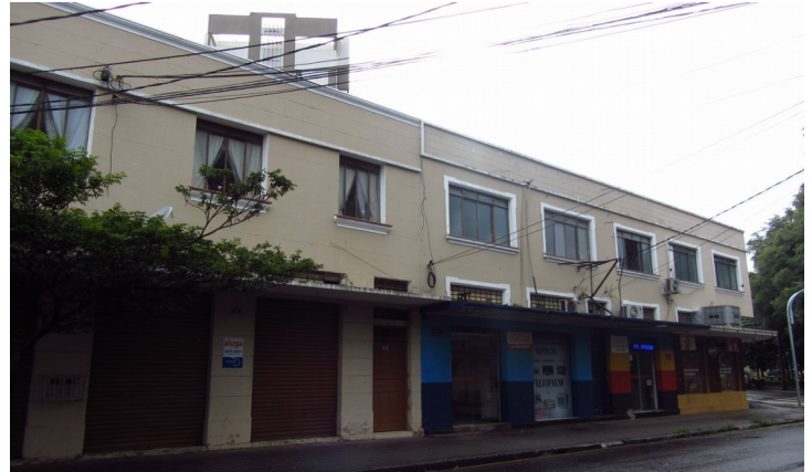
Edifício misto em 2018