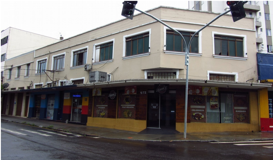
Esquina do Edifício, 2018