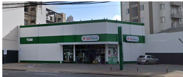
Edifício foi demolido, atualmente se encontra uma farmácia no local, 2023