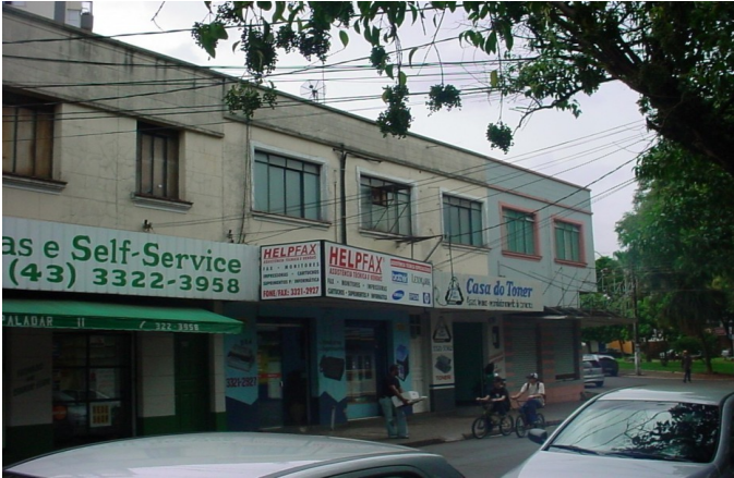
Edifício misto em 2006