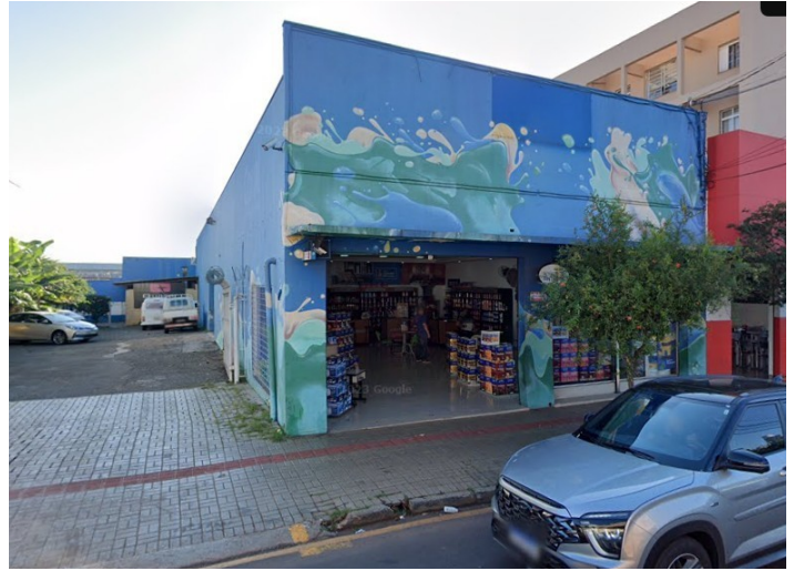
Fachada atual, 2023