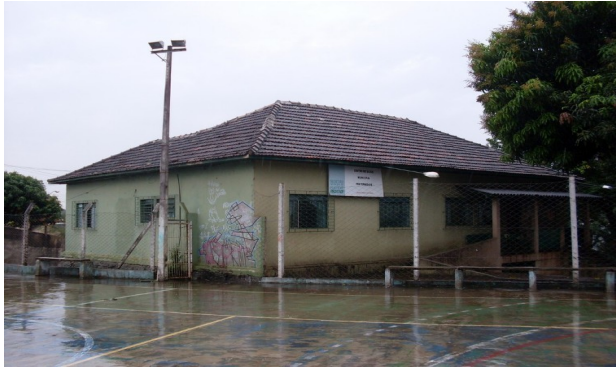
Vista do edifício através da quadra