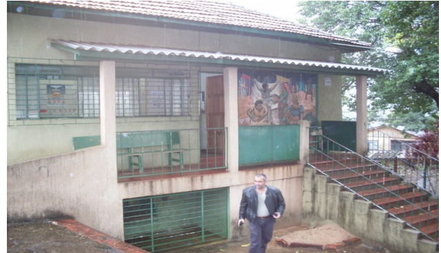
Vista da fachada