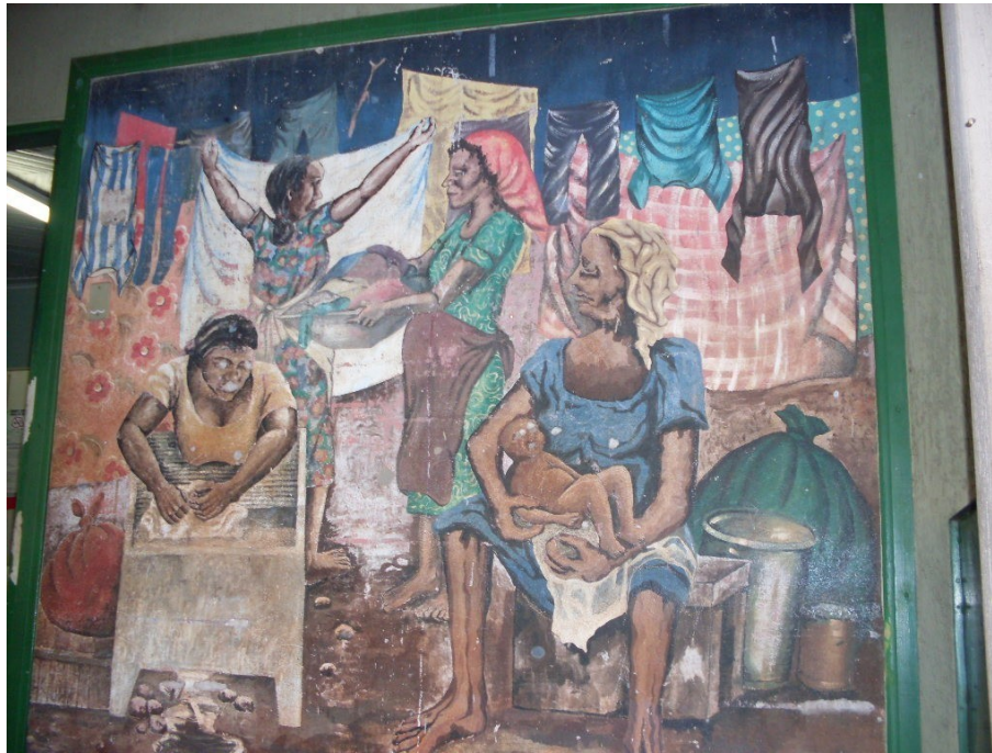
Arte na parede do posto de saúde