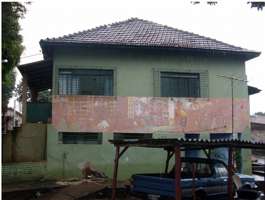
Fachada lateral do posto de saúde