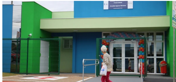
Fachada da nova UBS recém inaugurada, 2023