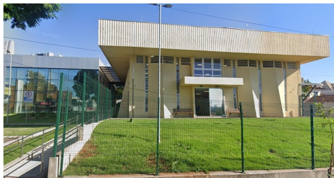
Vista da fachada atualmente, atual Casa da Educação, 2023