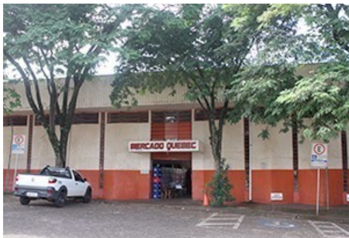
Vista do Edifício