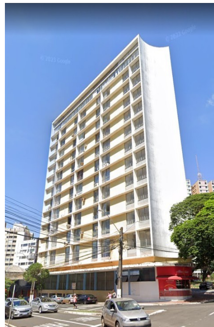
Vista do edifício atualmente, 2023