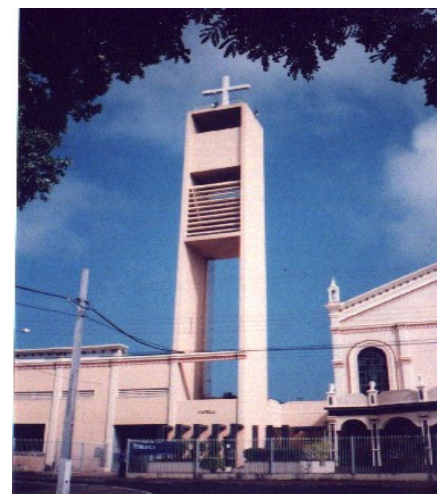
Campanário de 25m de altura.