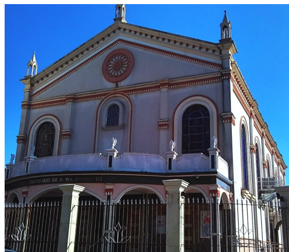
Foto atual da paróquia em 2018.