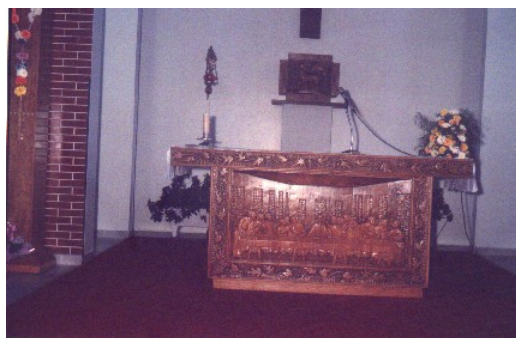
Altar Eucarístico em 1993.