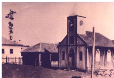
Primeira capela ,1940