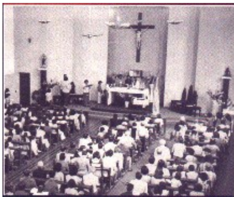
Vista interna na década de 70.