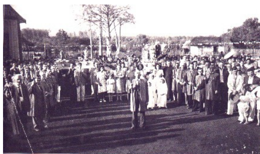
Procissão da paróquia na década de 40.