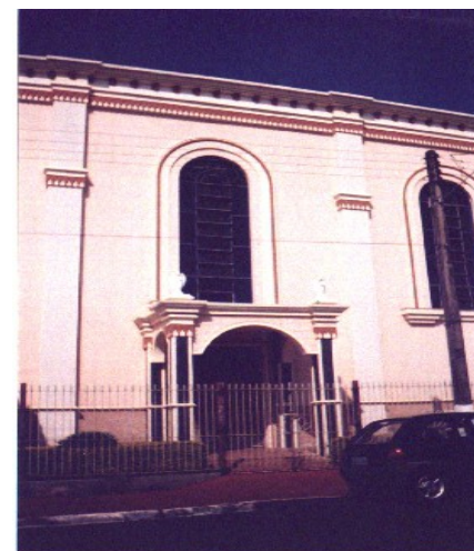
Entrada lateral da Igreja.