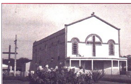
1ª Igreja em alvenaria ,1960 Fonte: SILVA et ali.