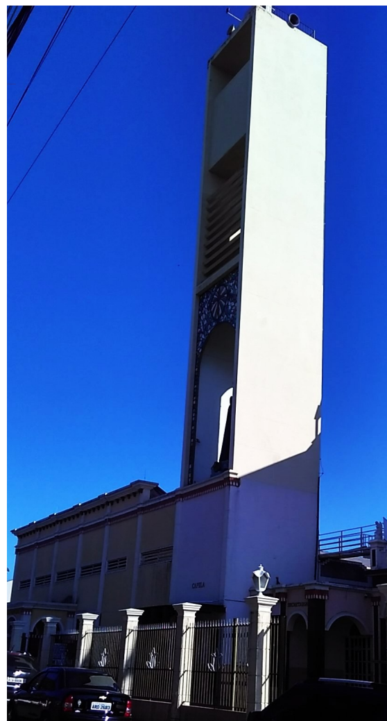
Vista da torre.