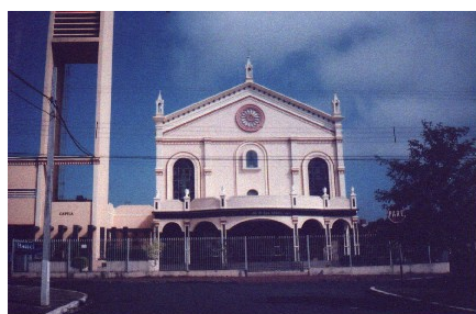
Alteração de fachada em 2001