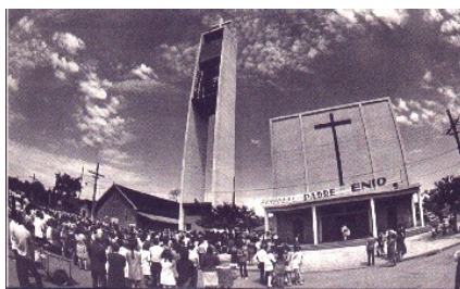
Alteração de fachada em 1964