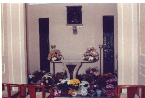
Vista interna da capela em 2001.. Fonte: SILVA et ali.