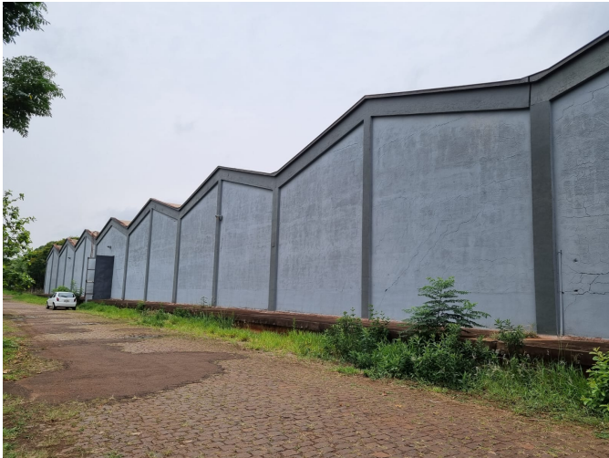
Barracão 1, 2024