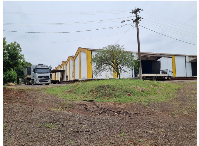
Barracão 2 – Locado por empresas privadas, 2024