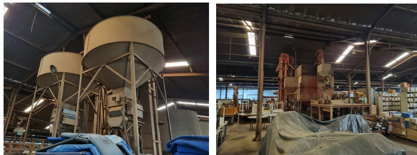
Maquinas antigas de café pertencentes ao IBC, 2024