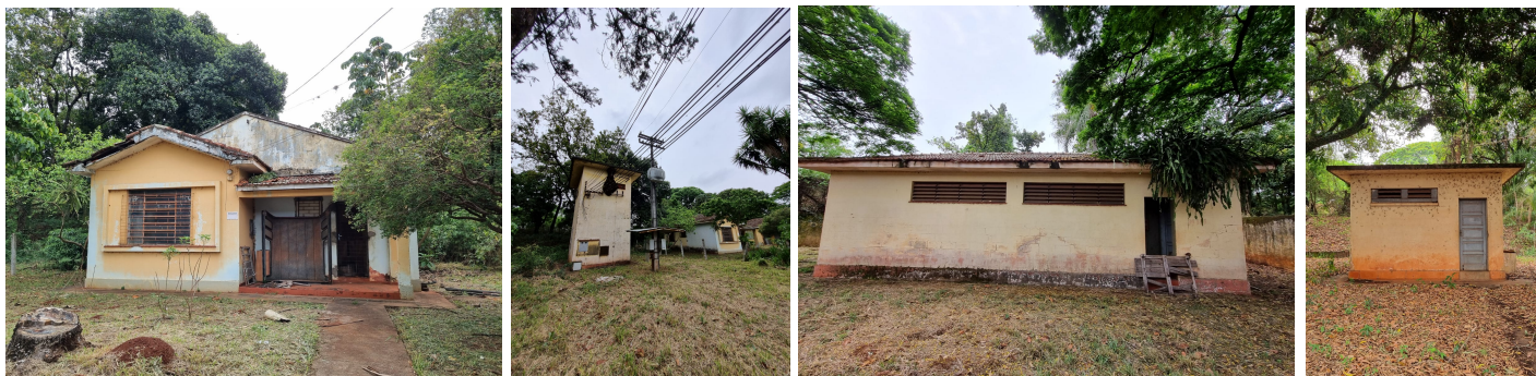
Construções em conjunto com o barracão 1, 2024