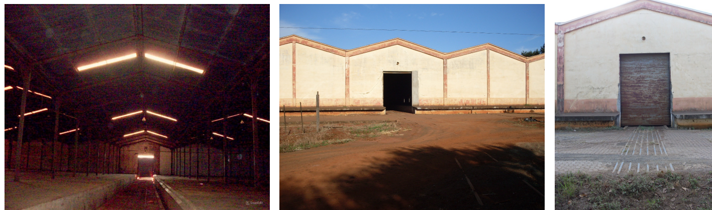
Barracão 2- Locado por empresas privadas, 2014