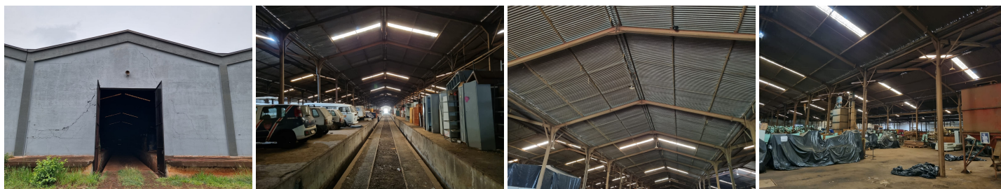
Barracão 1, 2024