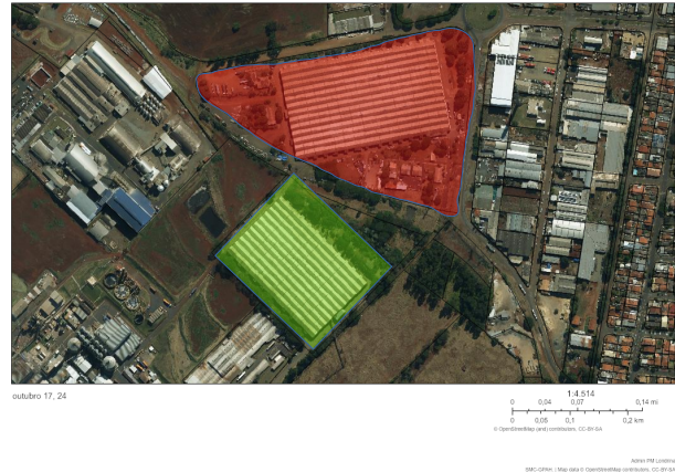
Oerofoto 2021.