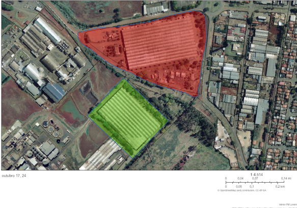
Ortofoto Infraero 2019-2020.